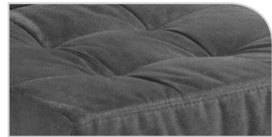
Sitzsteppung Variante 1A