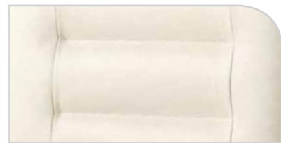
Rückensteppung Variante 1B