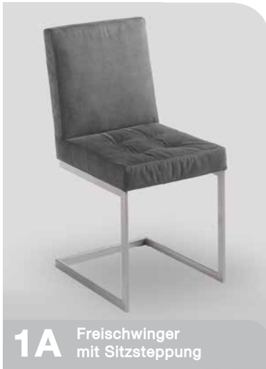
1A Freischwinger mit Sitzsteppung