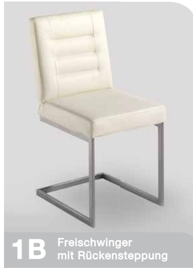
1B Freischwinger mit Rückensteppung