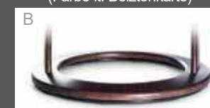
Holzdrehring in Buche (Farbe lt. Beiztonkarte)