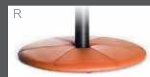
Bezogener Teller (Leder oder Stoff)