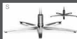
Metall-Sternfuß schmal - verchromt - Edelstahloptik - Anthrazit (pulverbeschichtet)