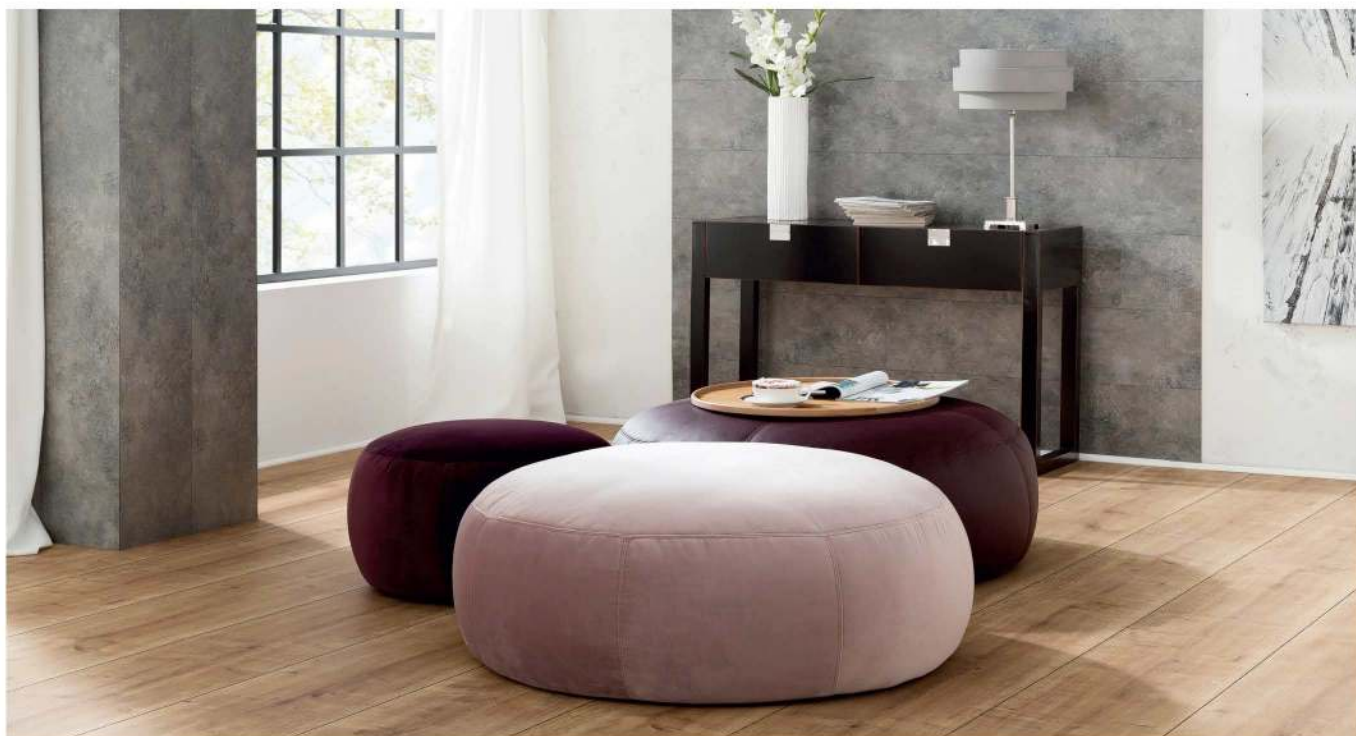
Hocker rund (Ø 105 cm) - Hocker rund (Ø 60 cm)