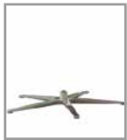
5-Sternfuß versch. Metallfarben 3 Sitzhöhen F U1