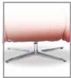
4-Sternfuß, Mehrpreis 3 Sitzhöhen F U4.