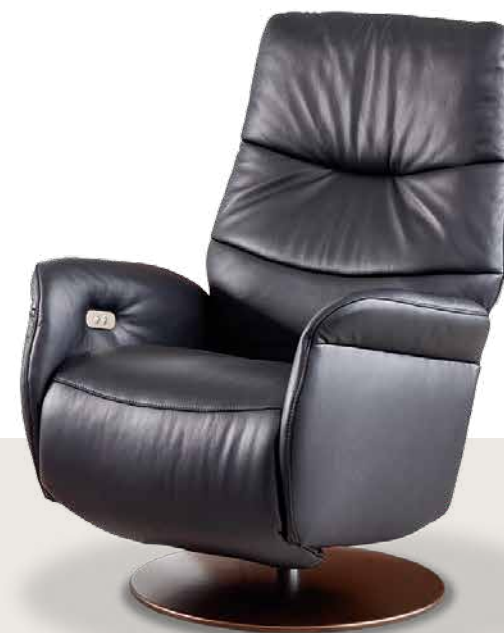
Bezug: Z73/99 nachtschwarz

[limboo] kann man ergonomisch manuell oder elektrisch verstellen und in einen super bequemen Relax-Sessel verwandeln. Verschiedene Füße stehen zur Auswahl in mehreren Metalltönen.