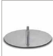
Drehteller verschiedene Metallfarben 3 Sitzh. - FU2. F 6Q