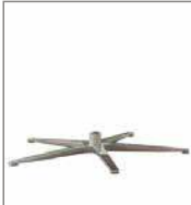
5-Sternfuß verschiedene Metallfarben 3 Sitzh. - FU1 F 99