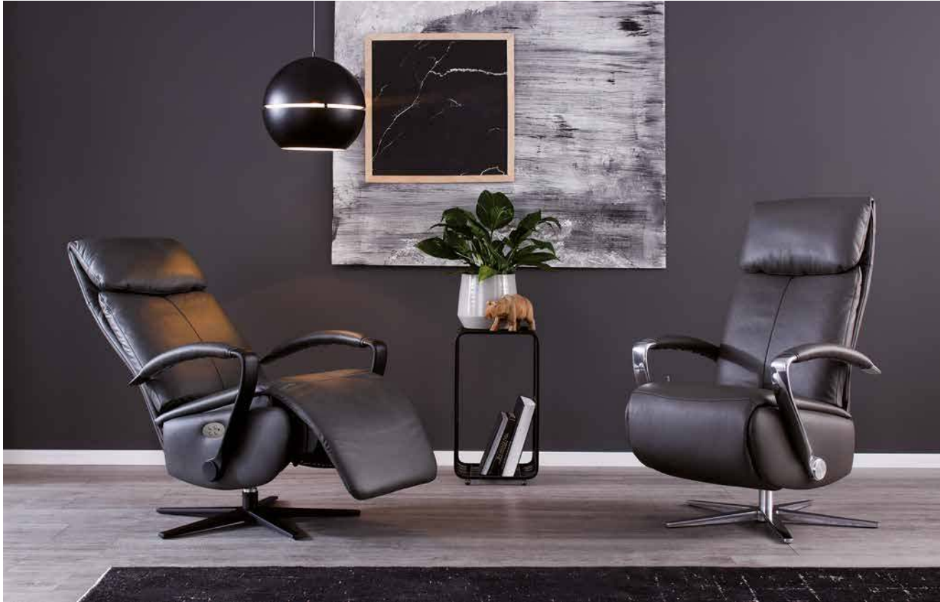
Bezug: Z69/95 anthracite