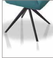
Metall-Drehkreuz inkl. Rückholfeder schwarz

Drehgestell inkl. Rückholfeder F W1 - in pul- verbeschichtet schwarz