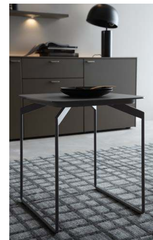
Beistelltisch CANNA* 4540-1866L: LBH 43/43/49 • Metall anthrazit matt • Keramik pazifikgrau