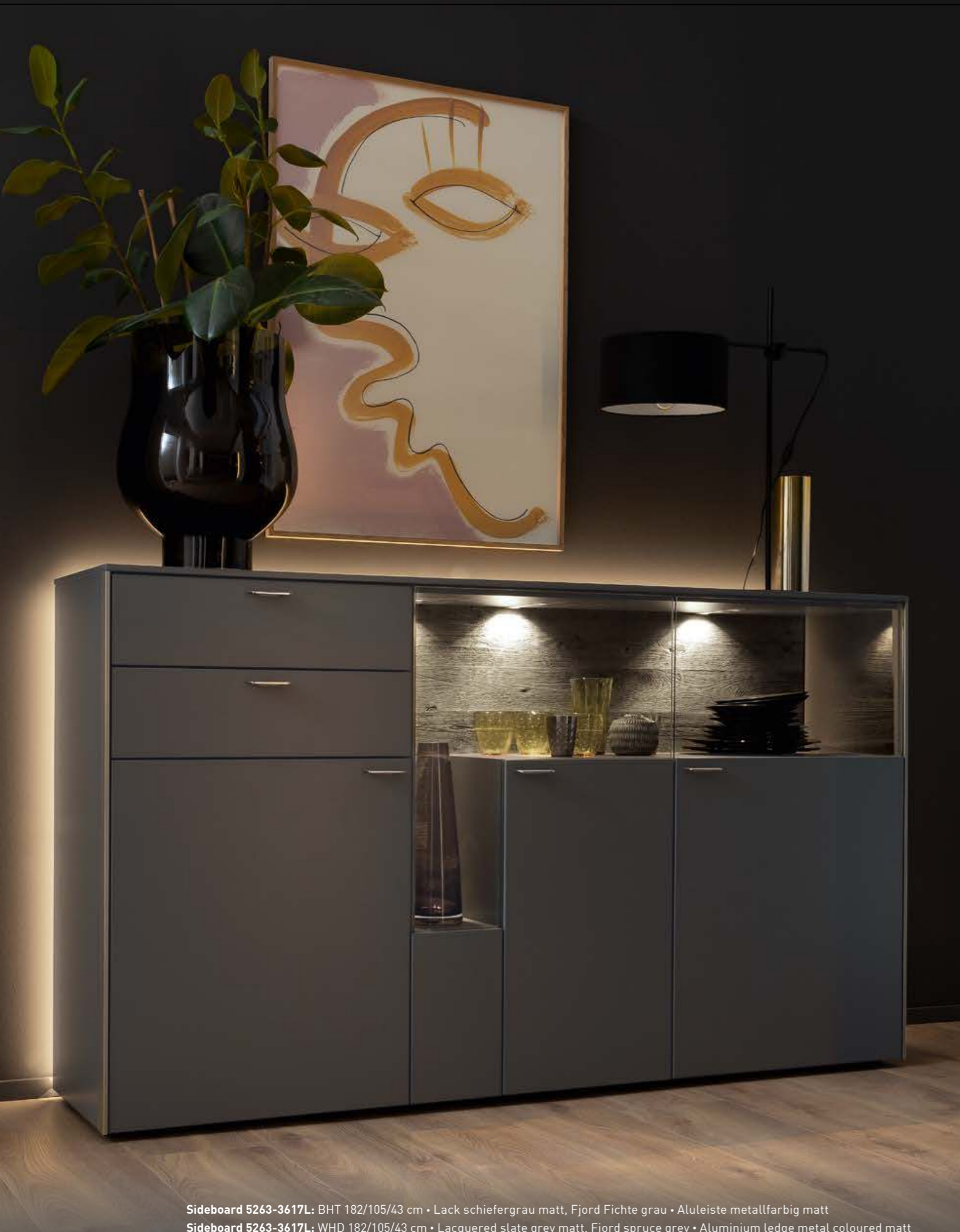
Sideboard 5263-3617L: BHT 182/105/43 cm • Lack schiefergrau matt, Fjord Fichte grau • Aluleiste metallfarbig matt Sideboard 5263-3617L: WHD 182/105/43 cm • Lacquered slate grey matt, Fjord spruce grey • Aluminium ledge metal coloured matt