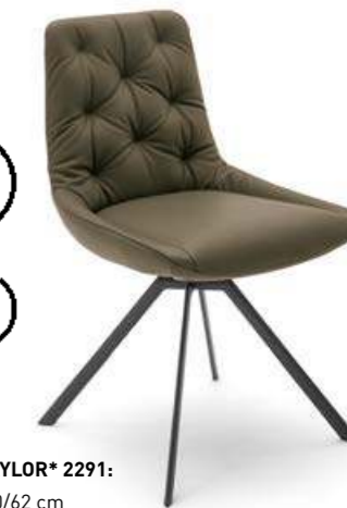
STUHL TAYLOR* 2291: BHT 53/90/62 cm

Exclusive-Edition: Erhältlich nur bei selektiven Handelspartnern Only available at selected retailers