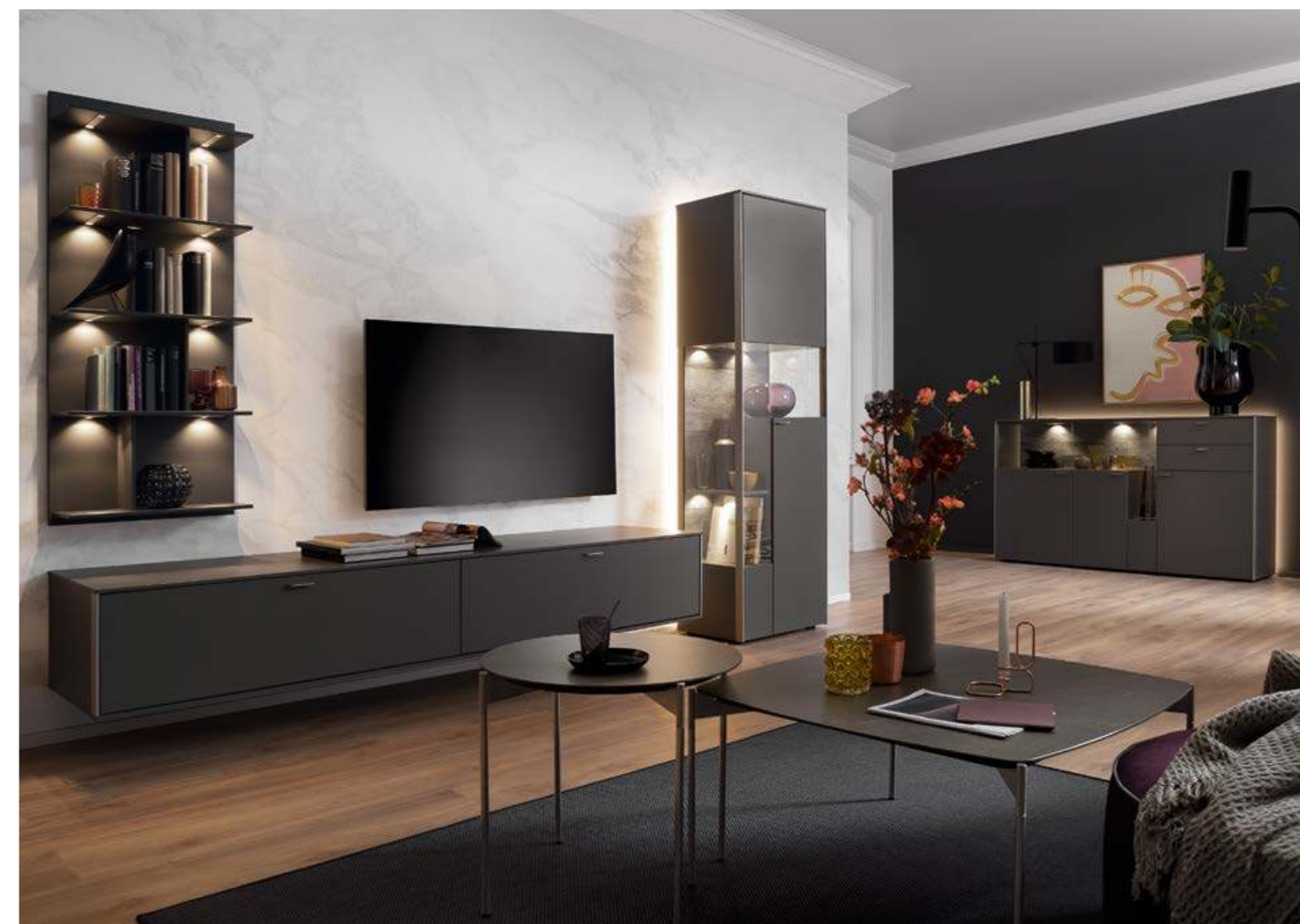
Kombination SI04-3617L: BHT 324/207/53 cm • Sideboard 5263-3617R: BHT 182/105/43 cm • Lack schiefergrau matt, Fjord Fichte grau • Aluleiste metallfarbig matt • Couchtisch RIO* 4942-1766M: LBH 83/83/42 cm • Beistelltisch RIO* 4946-1766L: LBH Ø 55/49 cm • Edelstahl optik, Keramik pazifikgrau