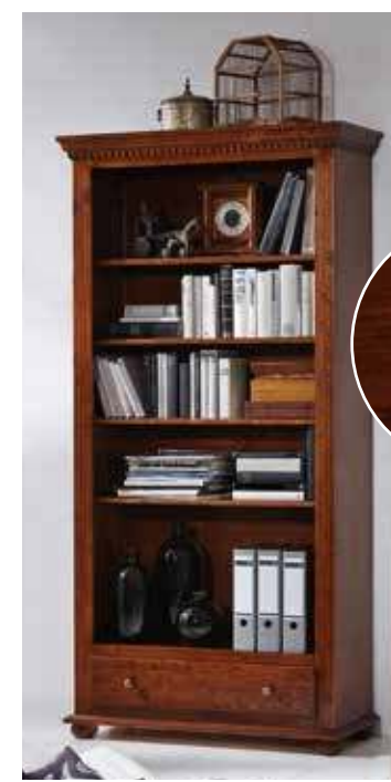
Regal 1960 4 Einlegeböden B 98 / H 195 / T 39 cm Abbildung: bassano lackiert mit Gebrauchsspuren