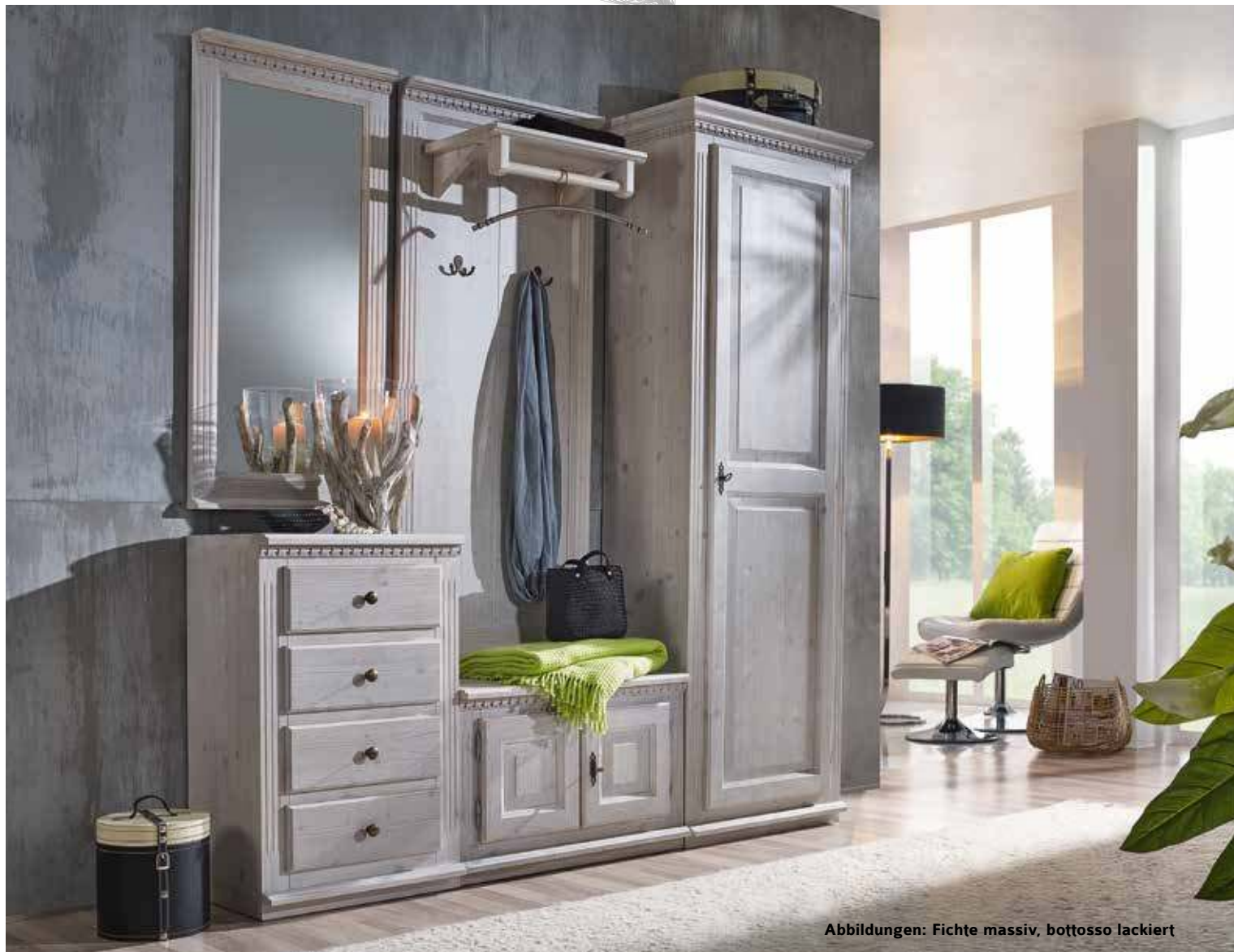
Abbildungen: Fichte massiv, bottosso lackiert