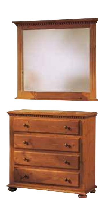
Spiegel 1940 B 98 / H 85 / T 7 cm Abbildung: firenze lackiert Schubkommode 1968 B 95 / H 90 / T 39 cm Abbildung: firenze lackiert