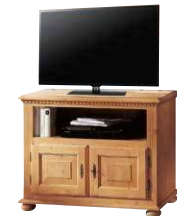
Phonokommode 1991 1 Einlegeboden B 95 / H 75 / T 50 cm Abbildung: natur gewachst