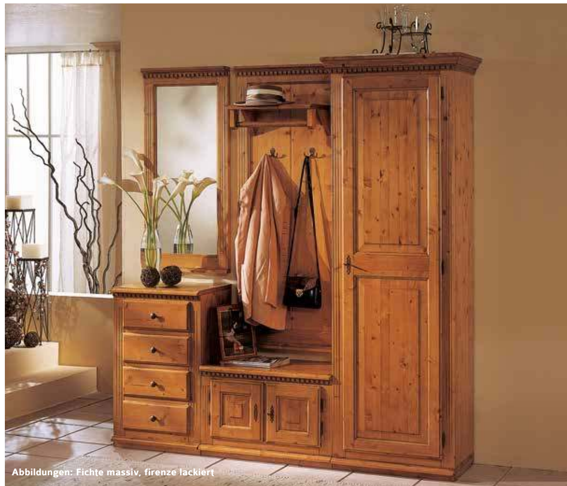
Abbildungen: Fichte massiv, firenze lackiert