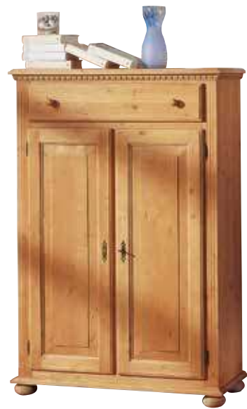
Vertiko 1965 2 Einlegeböden B 95 / H 140 / T 39 cm Abbildung: natur gewachst

Alle Kommoden auch ohne Platten- und Bodenüberstand und mit Sockel lieferbar zum Anstellen an die Garderobenkombinationen.