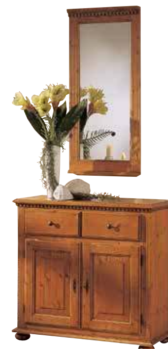
Spiegel 1930 B 50 / H 108 / T 7 cm Abbildung: firenze lackiert Kommode 1921 1 Einlegeboden B 95 / H 90 / T 39 cm Abbildung: firenze lackiert