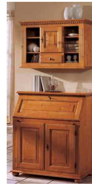
Hängeschrank 1981 passt auch über alle Kommoden B 92 / H 60 / T 31 cm Abbildung: firenze lackiert