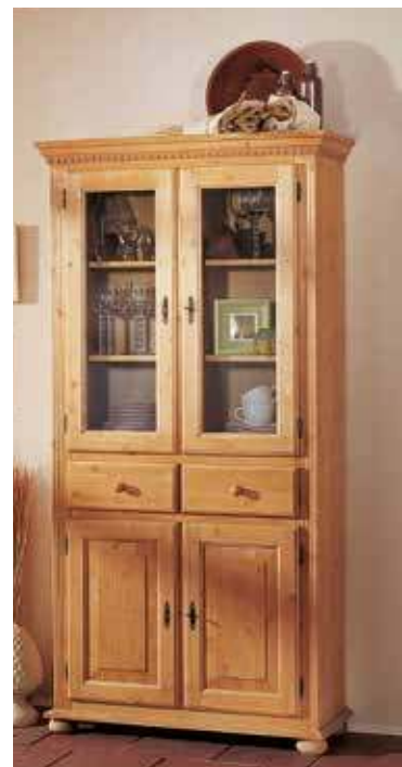
Vitrine 1962 oben 2 Einlegeböden, unten 1 Einlegeboden B 98 / H 195 / T 39 cm Abbildung: natur gewachst