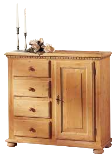
Kommode 1990 1 Einlegeboden B 95 / H 90 / T 39 cm Abbildung: natur gewachst