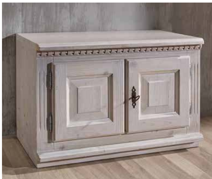
Unterschrank 1973 1 Einlegeboden B 70 / H 46 / T 39 cm Abbildung: bottosso lackiert