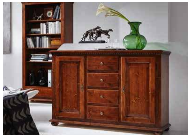
Sideboard 1923 je 1 Einlegeboden B 137 / H 90 / T 39 cm Abbildung: bassano lackiert mit Gebrauchsspuren