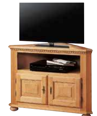
Eckphonokommode 1993 Schenkelmaß 80 cm, 1 Einlegeboden B 112 / H 75 / T 74 cm Abbildung: natur gewachst