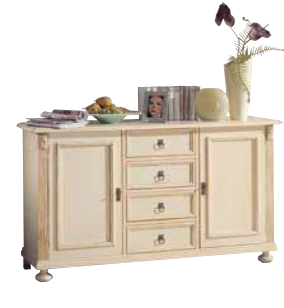
Sideboard 1423 je 1 Einlegeboden B 159 / H 90 / T 44 cm Abbildung: weiß gewischt lackiert mit Gebrauchsspuren