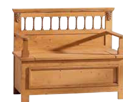
Truhenbank 1411 B 115 / H 91 / T 43 cm Abbildung: antik gewächst mit Gebrauchsspuren