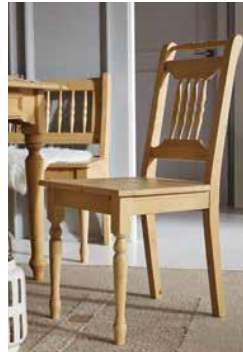
Stuhl 1431 B 43 / H 90 / T 54 cm Abbildung: naturmatt lackiert