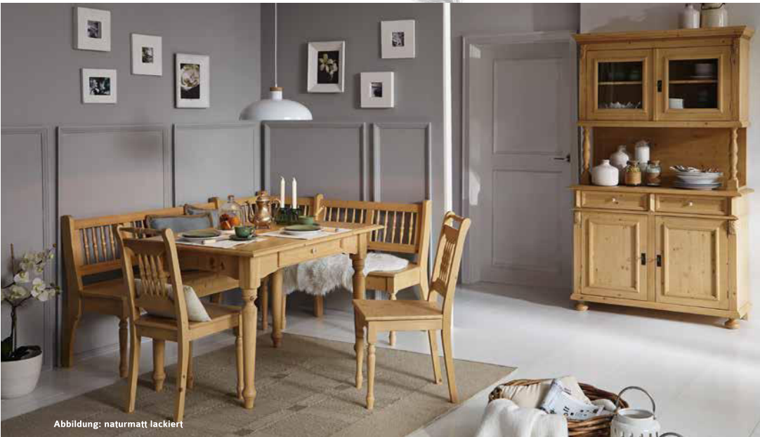
Abbildung: naturmatt lackiert