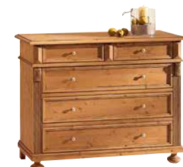
Schubkommode 1468 B 116 / H 90 / T 44 cm Abbildung: antik gewächst mit Gebrauchsspuren