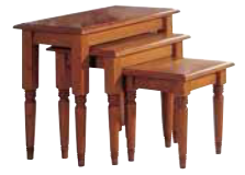
Beistelltisch groß 1437 B 72 / H 61 / T 37 cm Beistelltisch mittel 1436 B 54 / H 51 / T 37 cm