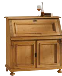
Sekretär 1480 1 Einlegeboden B 107 / H 105 / T 42 cm Abbildung: antik gewachst mit Gebrauchsspuren

Griffvarianten in Holz (26 Farben), Metall und Porzellan