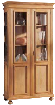
Vitrine 1462 4 Einlegeböden B 100 / H 194 / T 45 cm Abbildung: natur gewachst