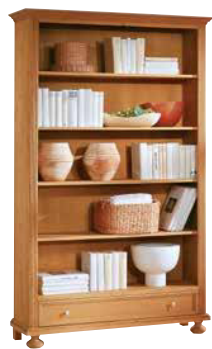
Regal 1460 4 Einlegeböden B 120 / H 194 / T 37 cm Abbildung: antik gewachst mit Gebrauchsspuren