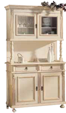
Buffetoberteil 1422 1 Einlegeboden B 117 / H 109 / T 36 cm