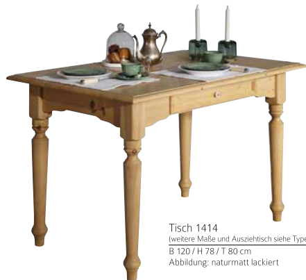
Tisch 1414 (weitere Maße und Ausziehtisch siehe Typenliste) B 120 / H 78 / T 80 cm Abbildung: naturmatt lackiert