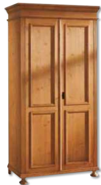
Schrank 1472 zerlegbar, 1 Kleiderstange, 1 Einlegeboden B 105 / H 201 / T 62 cm Abbildung: antik gewachst mit Gebrauchsspuren

Kombinieren leichtgemacht: Truhenbank 1409/1410 optional auch gleichschenklig (2 x B 93 cm / 2 x B 131 cm) mit Eckteil (B 53 cm) kombinierbar. Oder als Einzel-Bänke (in Reihe oder parallel) frei stellbar.