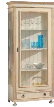
Vitrine 1461 3 Einlegeböden B 91 / H 194 / T 45 cm Abbildung: weiß gewischt lackiert mit Gebrauchsspuren