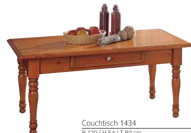
Couchtisch 1434 B 120 / H 54 / T 80 cm Abbildung: firenze lackiert