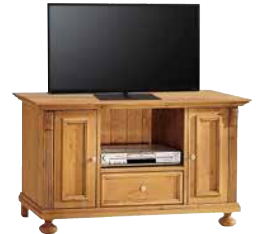
TV-Kommode 1491 2 Auszüge, 1 Schublade B 115 / H 68 / T 54 cm Abbildung: antik gewachst mit Gebrauchsspuren