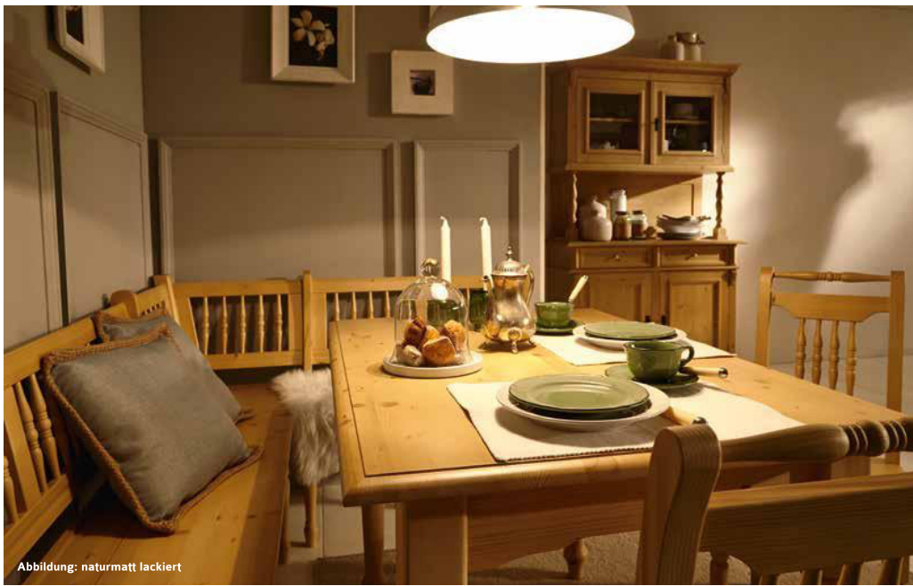
Abbildung: naturmatt lackiert