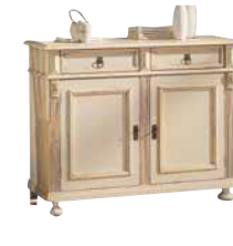
Kommode 1421 1 Einlegeboden B 116 / H 90 / T 44 cm Abbildung: weiß gewischt lackiert mit Gebrauchsspuren