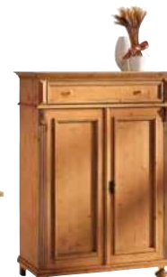
Vertiko 1465 2 Einlegeböden B 100 / H 137 / T 44 cm Abbildung: antik gewächst mit Gebrauchsspuren