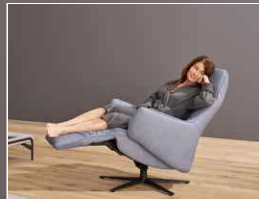
Bezug: 27 Leonessa cool