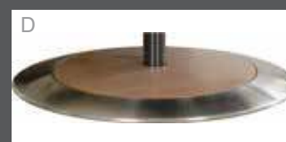
Holz mit Edelstahlring