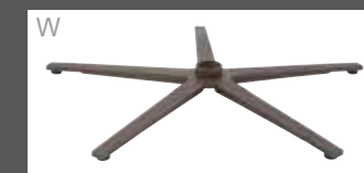
Sternfuß Bronze pulverbeschichtet