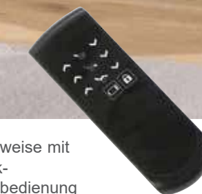
wahlweise mit Funk- Fernbedienung (Beispieldarstellung)