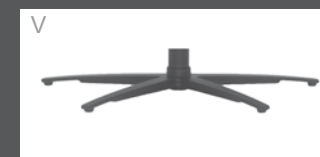
Sternfuß Anthrazit pulverbeschichtet