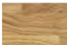
Eiche natur wahlweise lackiert oder geölt