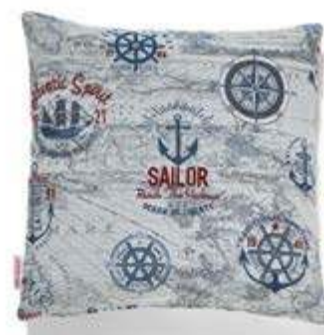
Bezug: 65 10 10 Größen: 40 x 40 und 50 x 50