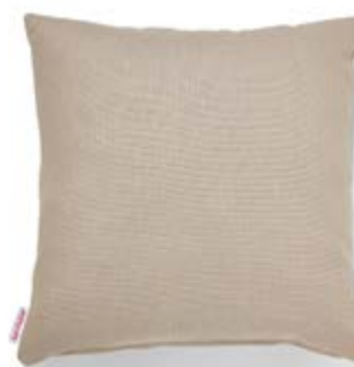
Bezug: 65 09 85 Größen: 40 x 40 und 50 x 50