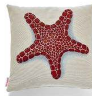
Bezug: 65 10 05 Größe: 40 x 40