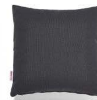
Bezug: 65 09 89 Größen: 40 x 40 und 50 x 50