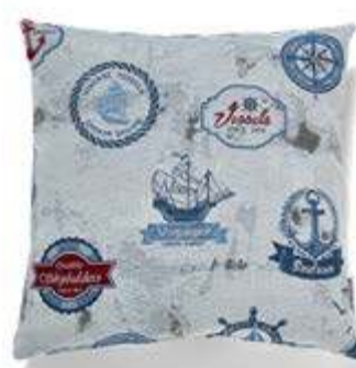
Bezug: 65 10 11 Größen: 40 x 40 und 50 x 50