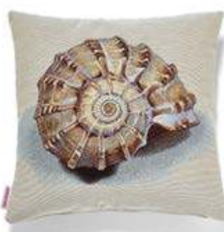
Bezug: 65 10 06 Größe: 40 x 40