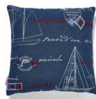
Bezug: 65 10 15 Größen: 40 x 40 und 50 x 50