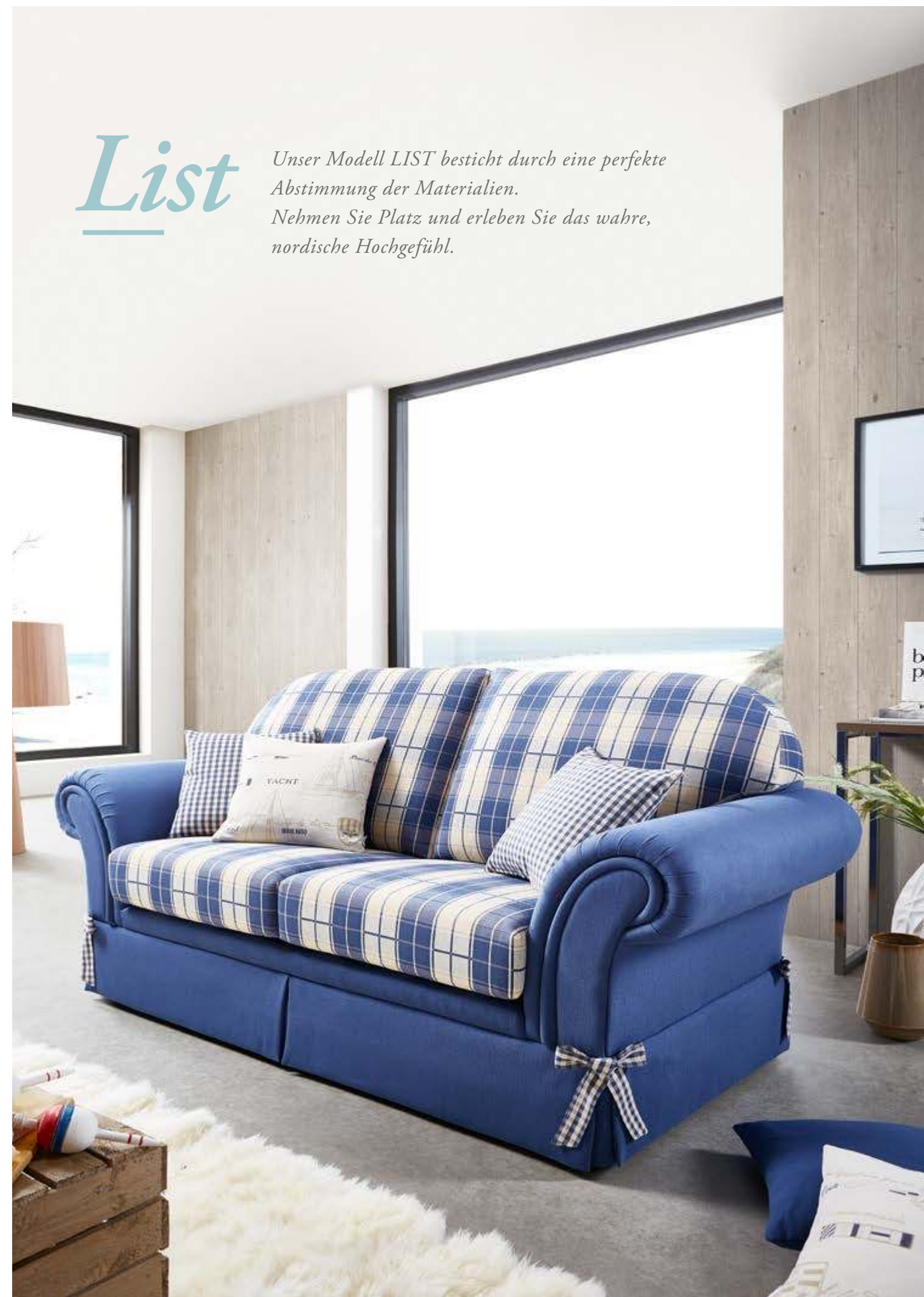
Modell List | 2,5-Sitzer | Bezug: Sitz + Rücken 65 09 27, Korpus 65 09 87, Schliefe 65 09 37

Unser Modell LIST besticht durch eine perfekte Abstimmung der Materialien. Nehmen Sie Platz und erleben Sie das wahre, nordische Hochgefühl.