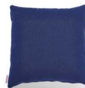
Bezug: 65 09 87 Größen: 40 x 40 und 50 x 50