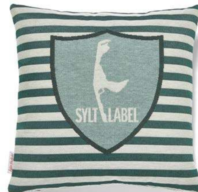
Bezug: 65 10 03 Größe: 40 x 40