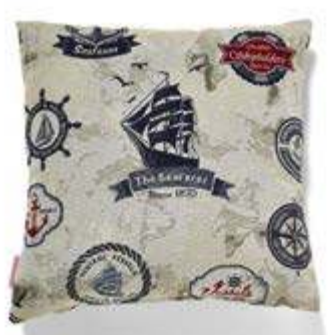
Bezug: 65 10 13 Größen: 40 x 40 und 50 x 50