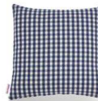
Bezug: 65 09 37 Größen: 40 x 40 und 50 x 50