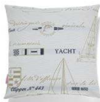
Bezug: 65 10 16 Größen: 40 x 40 und 50 x 50

Dekokissen 40 x 40 cm oder 50 x 50 cm sind in allen Bezugsstoffen aus der SCHRÖNO Stoffkollektion lieferbar, sowie in diesen speziellen Dessins: