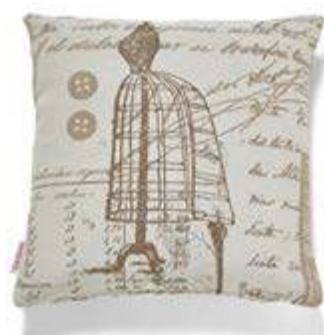
Bezug: 65 10 18 Größen: 40 x 40 und 50 x 50