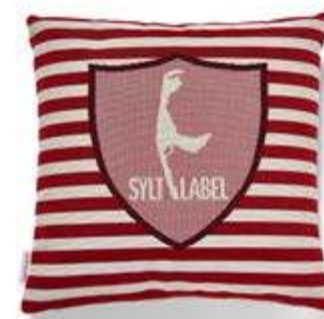
Bezug: 65 10 01 Größe: 40 x 40