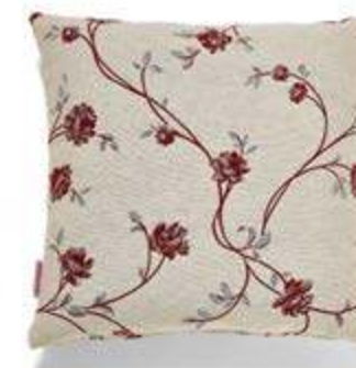
Bezug: 65 09 48 Größen: 40 x 40 und 50 x 50