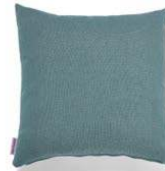
Bezug: 65 09 86 Größen: 40 x 40 und 50 x 50