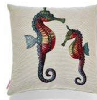
Bezug: 65 10 07 Größe: 40 x 40