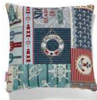
Bezug: 65 10 14 Größen: 40 x 40 und 50 x 50