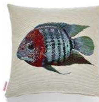
Bezug: 65 10 08 Größe: 40 x 40