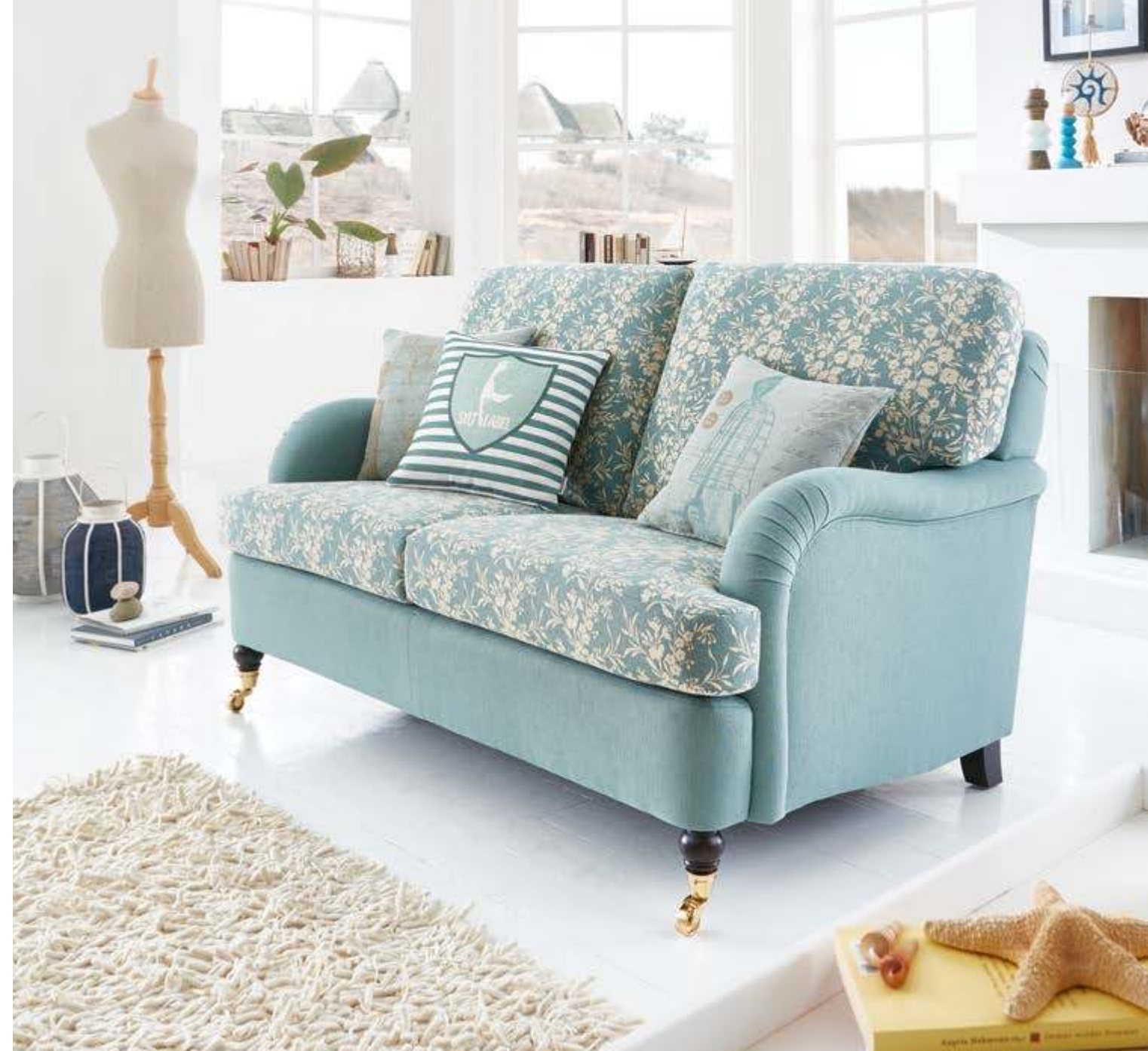
● ● ● Modell Keitum | 2,5-Sitzer | Bezug: Sitz + Rücken 65 09 76, Korpus 65 09 86 | Fuß: Buche maronfarbig mit massiver Messingrolle (vorne)

Unsere Kreationen aus dem Modell KEITUM verbinden perfekt das Innovative und die hohe Qualität unserer Polstermöbel. Damit lässt sich jeder Raum inspiriert gestalten.