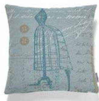
Bezug: 65 10 17 Größen: 40 x 40 und 50 x 50