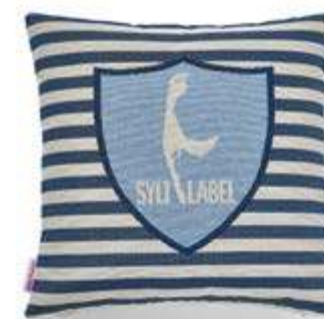
Bezug: 65 10 02 Größe: 40 x 40