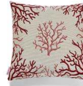
Bezug: 65 10 04 Größe: 40 x 40