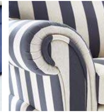
Besondere Details und klare Linien – perfektes Zusammenspiel