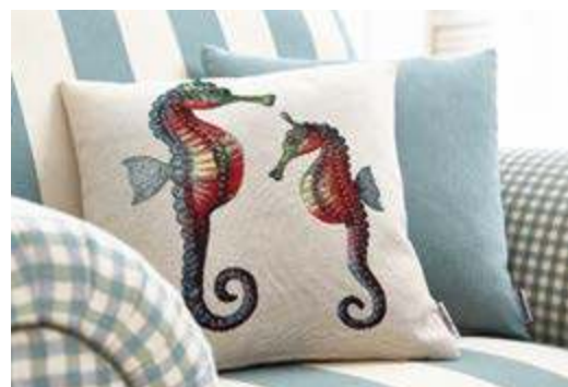
Aparte Details aus der Welt des Meeres

Der hochwertige Materialmix im dezenten Retro-Look sorgt für einen echten Hochgenuss an Komfort. Das kontrastreiche Design gibt dem gesamten Ensemble eine unbeschwerte Leichtigkeit, die sehr einladend wirkt.