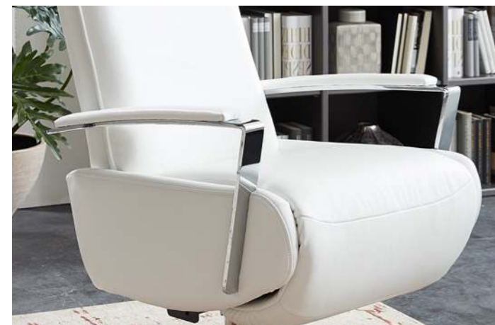
PERTH 2340 mit Chromarmlehne