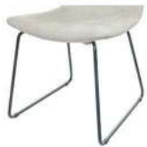
1095 Metallgestell schwarz matt Standard