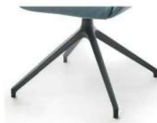
1016 Spinnenfuß drehbar schw. matt strukt. (gegen Aufpreis)