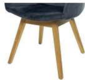
1097 Holzgestell Eiche geölt (gegen Aufpreis)