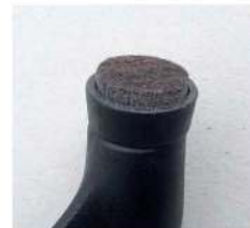
Filzgleiter (gegen Aufpreis)