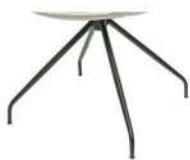
991 Spinnenfuß drehbar schwarz matt (gegen Aufpreis)