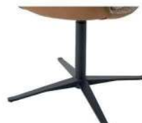
1071 Viersternfuß drehbar schwarz matt (gegen Aufpreis)