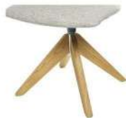
994 Spinnenholzfuß drehbar Eiche geölt (gegen Aufpreis)