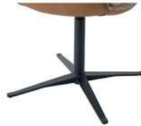
1071 Viersternfuß drehbar schwarz matt (gegen Aufpreis)