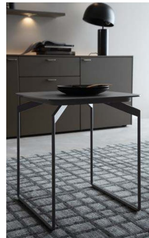
Beistelltisch CANNA* 4540-1866L: LBH 43/43/49 • Metall anthrazit matt • Keramik pazifikgrau