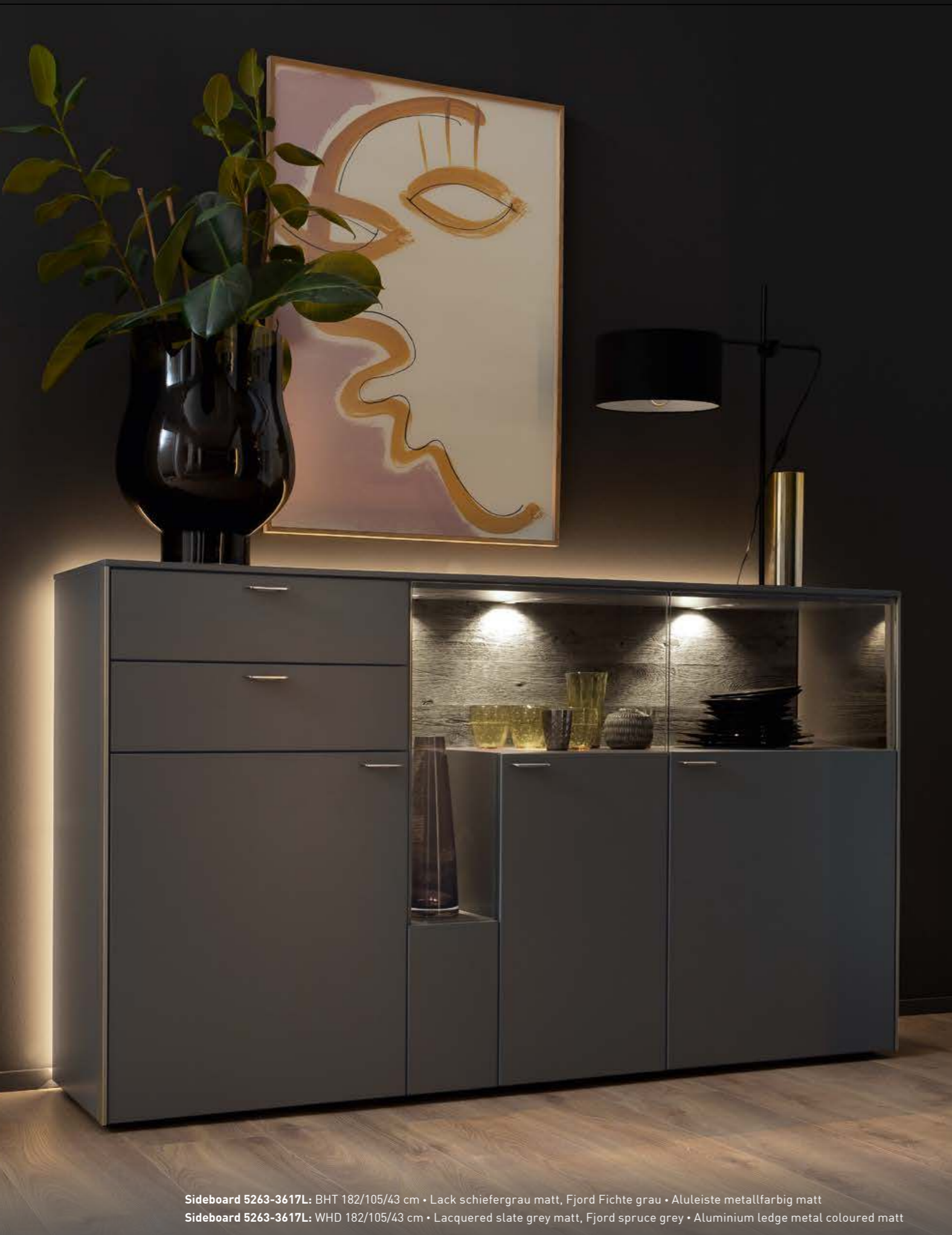
Sideboard 5263-3617L: BHT 182/105/43 cm • Lack schiefergrau matt, Fjord Fichte grau • Aluleiste metallfarbig matt Sideboard 5263-3617L: WHD 182/105/43 cm • Lacquered slate grey matt, Fjord spruce grey • Aluminium ledge metal coloured matt