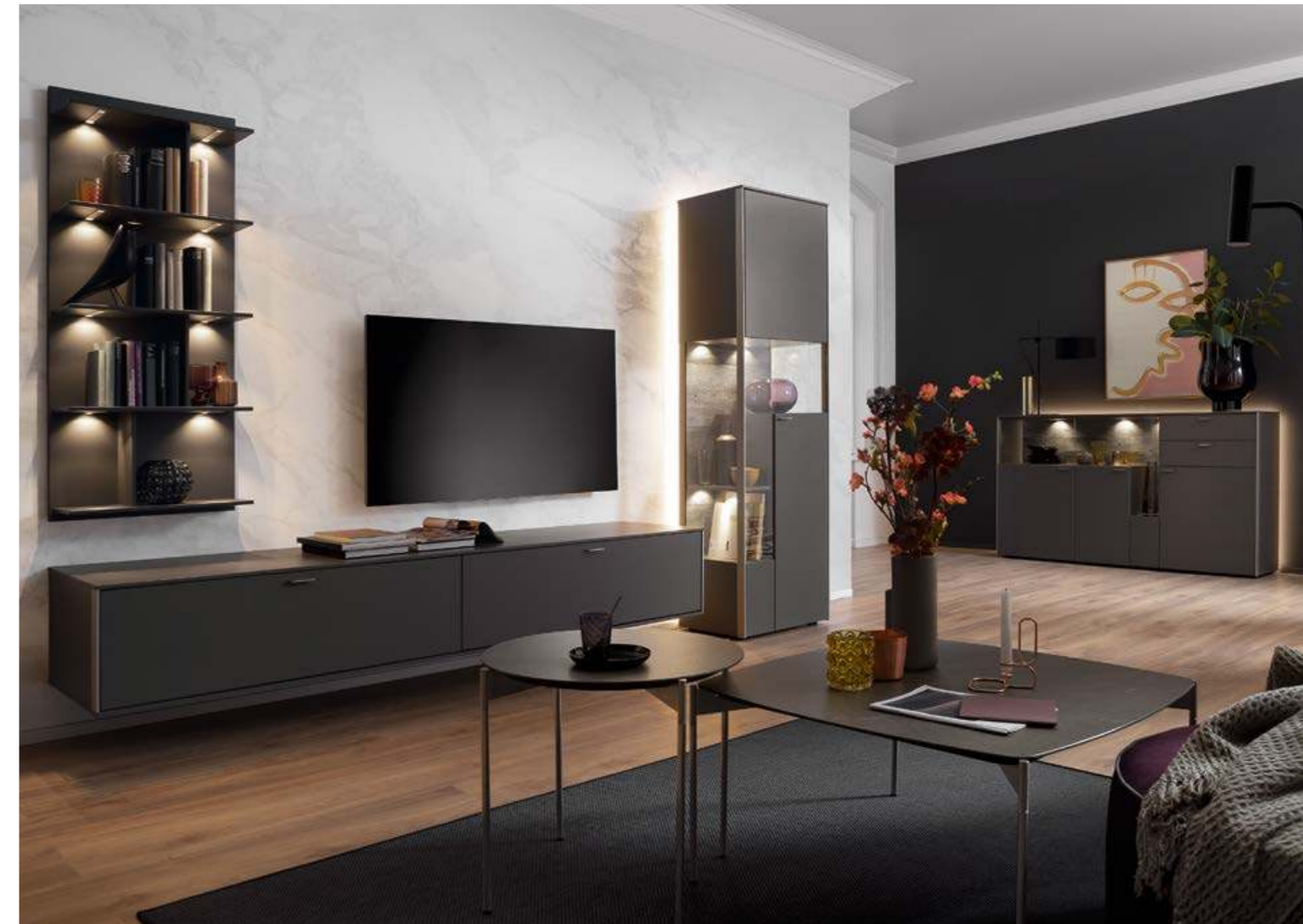
Kombination SI04-3617L: BHT 324/207/53 cm • Sideboard 5263-3617R: BHT 182/105/43 cm • Lack schiefergrau matt, Fjord Fichte grau • Aluleiste metallfarbig matt • Couchtisch RIO* 4942-1766M: LBH 83/83/42 cm • Beistelltisch RIO* 4946-1766L: LBH Ø 55/49 cm • Edelstahl optik, Keramik pazifikgrau